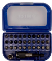
Juego de puntas de 1/4" con adaptador, dado y portapuntas 475-32-1